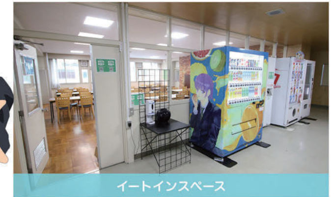
イートインスペース